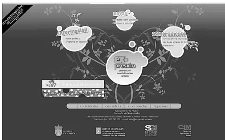
Páxina web do CIM de Soutomaior (www.ex-presion.com)